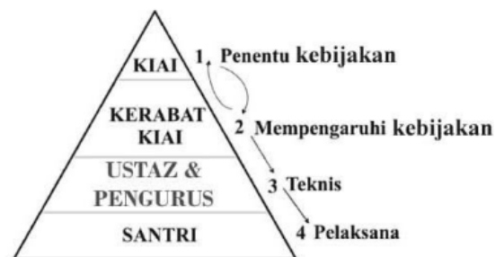
Gambar 1. Jaringan Kepemimpinan Kiai

memiliki kontribusi dalam keberhasilan pengembangan mutu dan pendidikan karakter. Jaringan kepemimpinan kiai di lembaga pendidikan dapat digambarkan sebagai berikut.